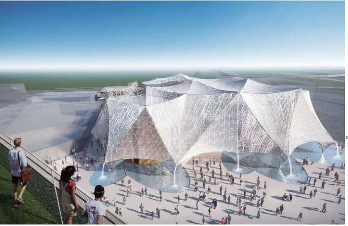
「大阪ヘルスケアパビリオン」外観予想図

「主役は子どもたち」「若い才能の飛躍も」です。大阪パビリオンの展示計画は、健康や気候変動などの課題を解決する「未来のスマイ」の展示を目指しています。子どもたちや若い世代、若い才能の飛躍も、夢を感じられるような展示を、コロンベを通じて実現したいと考えています。