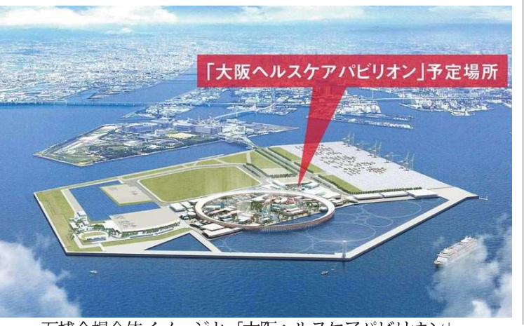
「大阪ヘルスケアパビリオン」予定場所

「コロンベ」の通り70年大阪万博では、若い建築家やクリエイターが活躍し、若い才能の飛躍も、夢を感じられるような展示を、コロンベを通じて実現したいと考えています。