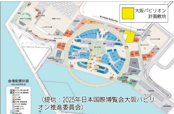
(提供：2025年日本国際博覧会大阪パビリオン推進委員会)

大阪府・市が、2025年日本国際博覧会に地元の自治体館として出展する「大阪パビリオン」は、会場の象徴となるパビリオンのリング状大屋根北側、東エントランス近く、近畿1万m強、来場者の多くが訪れやすい動線上に開設される。地上2階建てで高さ最大20mで、開催都市として世界各國から来館者を迎えるにふさわしいシンボル的な建築像を描いてほしいと思っています。