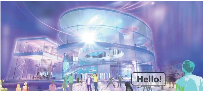
バーチャルパビリオンイメージ

0字以内の日本語か350ワード以内の英語表記と各種図面（配置図・平面図・立面図・断面図と透視図）CG、模型写真などで外部・内部空間の描写があるものを、また3Dモデリングした3D映像映像1分以内の動画、Web上にアップロードする形で応募する。 プロジェクト趣旨 時は2050年、ポストSDGsの世界です。DX（Digital Transformation）もますます加速し、都市構造や交通システムなどが進化していく中で、私たちは心身ともに健康であるWell-Beingな生活を営むことを目指しています。多様化した個人の価値観と科学技術の進展が、家族像、ライフスタイルを変革させ、現代の既成概念を超越した飛躍的なイノベーションによるスマイはどのようなカタチで出現するのでしょうか。大阪ヘルスケアパビリオンのテーマ、REBORNを具現化する「ミライREBORNスマイプロジェクト」は、未来社会を担う子どもたちへのメッセージです。将来への夢や希望、魅力の感じられる都市や住空間システム、生活像を描いて下さい。立地環境は地球上に限らず任意に設定し、集まって暮らす、孤独を楽しむ、多拠点を移動して暮らすなどのライフスタイルをイメージし、子育て、健康増進、療養・介護や趣味などを担う共助やコミュニティの社会システムも自由に想定してご提案下さい。入賞作品の中から2025年大阪・関西万博の大阪ヘルスケアパビリオンの展示映像コンテンツを共創により制作することを目標としています。来館者を一瞬で魅了し、感動が心に残り続けるような、未来に開花する映像とコンセプトの提案を期待します。