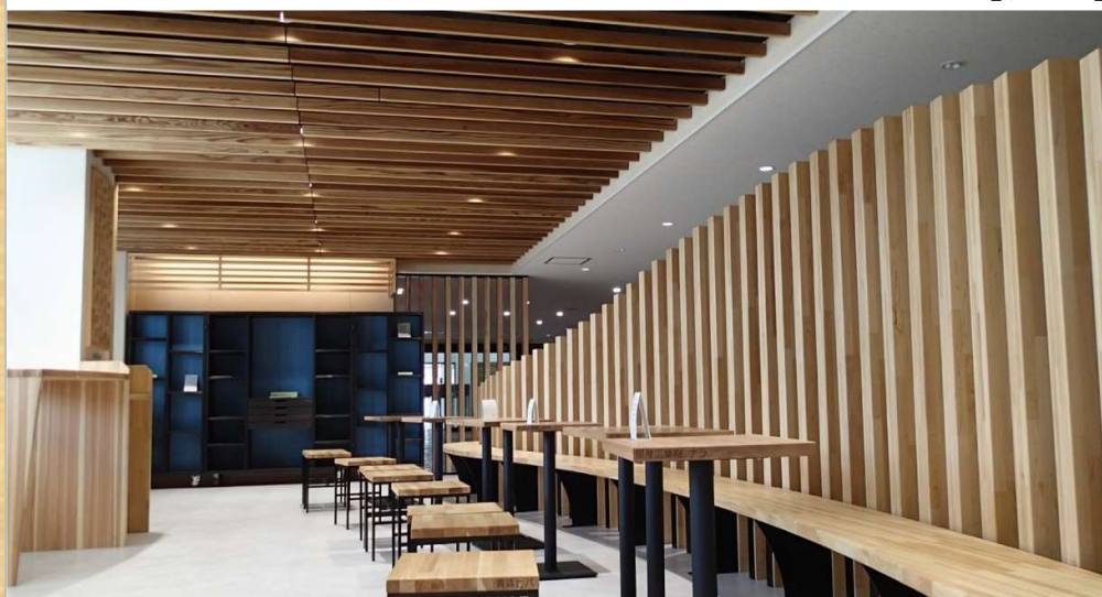
青森県庁舎1階 県民ホール

上北地域の建築士や設計士、市町村担当者等を対象に、木材の特性や利用方法等について学んでいただきます。